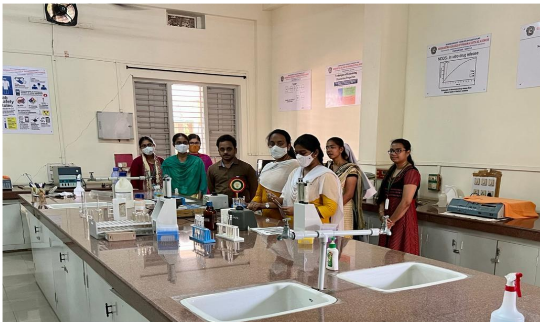
Practical Training in Preparation of Liposomes, Nanosuspensions and Microparticles